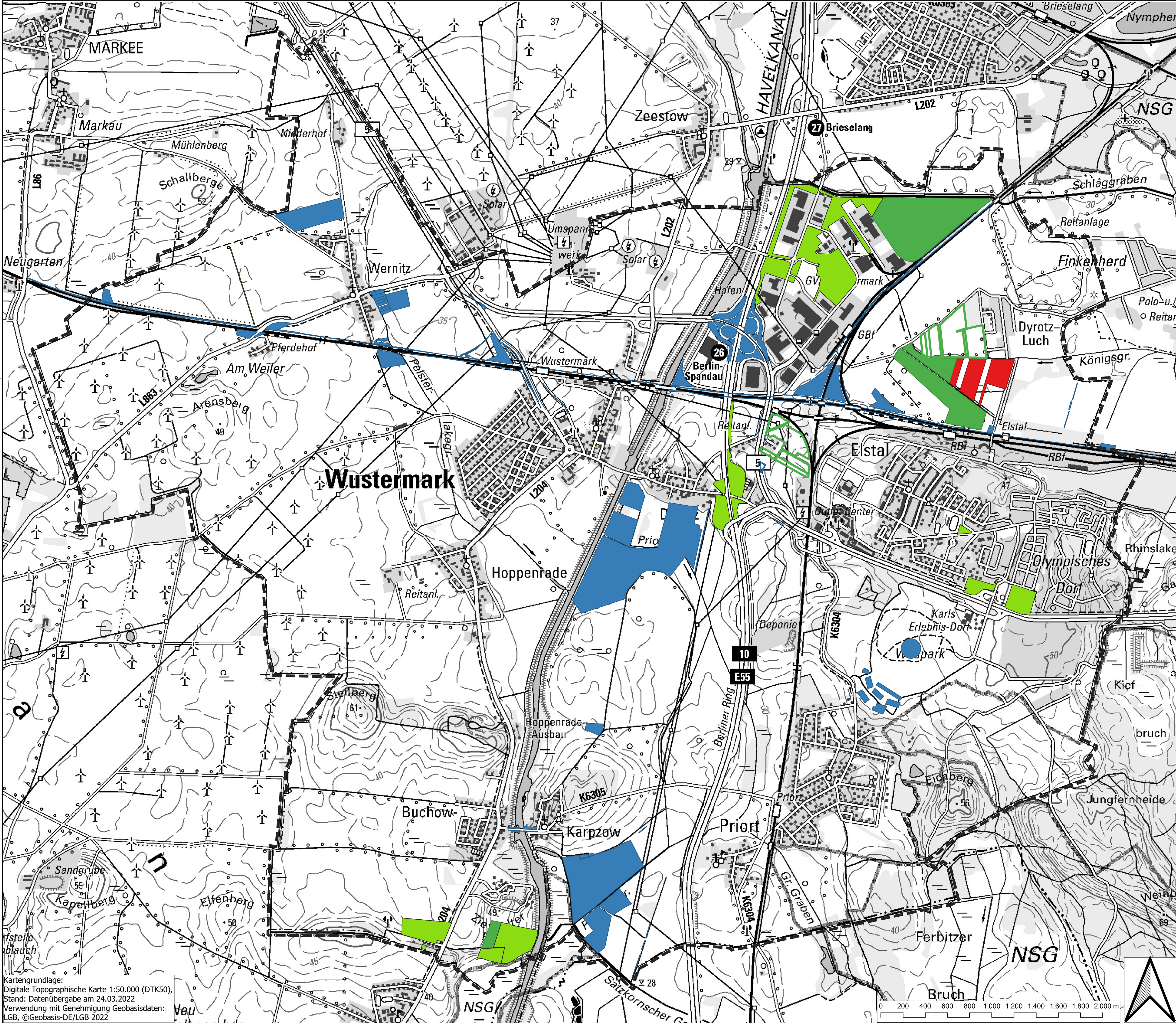
Karte 8: Kompensationsflächen