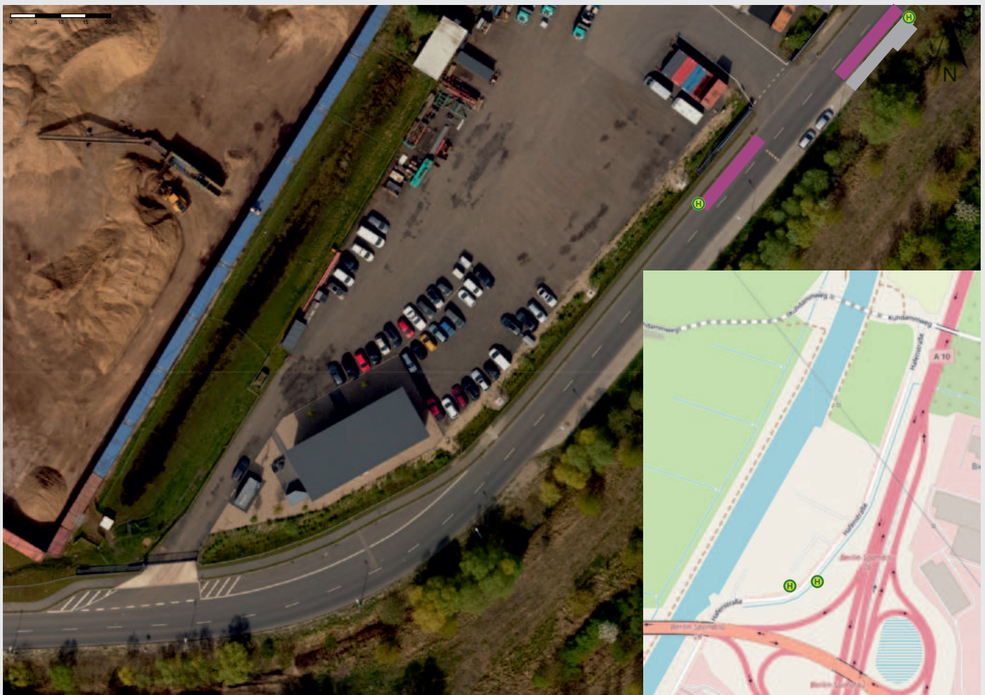
Wustermark GVZ, Hafenstraße 10